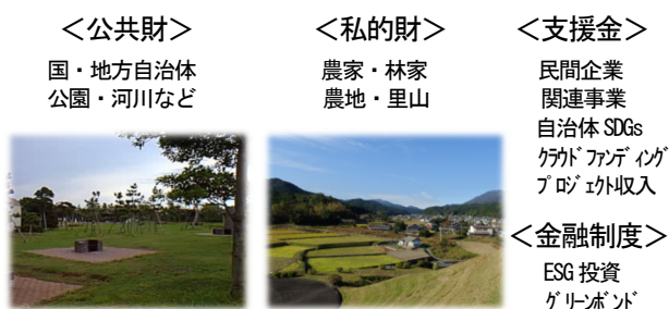
図-3 GI における資産の構成例

また、AM 計画には、組織が達成しようとする目標、運用及び維持・改善計画の他、国・自治体の公共予算（維持、修繕、更新計画）、支援制度などについてのコスト管理計画が必要となる。GI における資産の構成例を図3に示す。